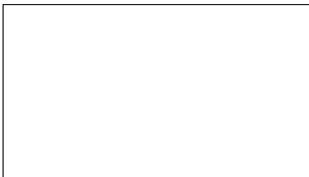
Схема границы балансовой принадлежности тепловых сетей

Прочие сведения по установлению границ раздела балансовой принадлежности тепловых сетей _____