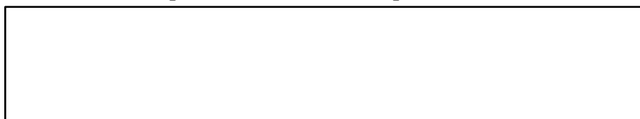
Схема границы балансовой принадлежности

—; (указать адрес, наименование объектов и оборудования, по которым определяется граница балансовой принадлежности водопроводных сетей централизованной системы горячего водоснабжения исполнителя и заявителя)